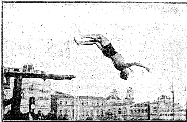
Un dels salts amb que els nortenyas aspiraven al Campionat.

La representació del C. N. Barcelona que aquest any ha defensat els nostres colors mereix