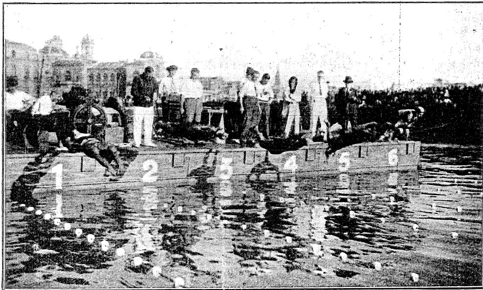
Un aspecte de la piscina on fingueren lloc els campionats d'Espanya a S. Sebastià. La sortida dels 100 m. lliure.

Participaren solament 3 senyoretetes, fou una