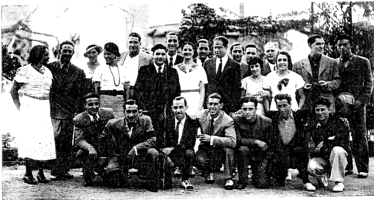
La representació catalana que actuà a Madrid i Lisboa a la seva arribada a la capital de la República

Després s'ha celebrat la de 1.500 metres estil lliure, de campionat.